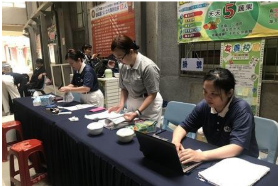
左圖：社區志工協助診療相關事宜。