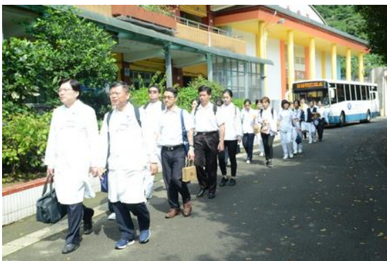
左圖：人醫團隊抵達瑞芳國中進行義診。